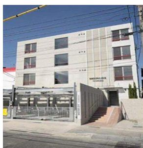
MODULOR 社台 (賃貸ワンルームマンション 32室)