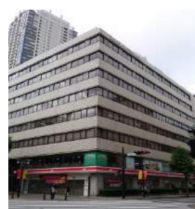
フジモト第一生命ビル (賃貸オフィスビル 35区画)