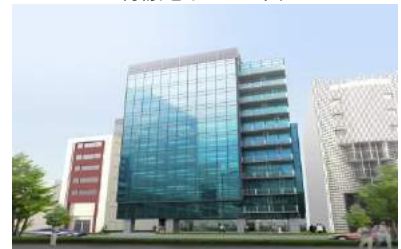
オフィスビルイメージ図

賃貸データ、ランニングコスト等を算出し、不動産から生じるキャッシュ・フローの分析を基に、用地周辺のマーケット動向を調査し、周辺の特성에応じたコンセプト（物件のデザイン性、利用者の機能性など）など企画し販売を行っております。