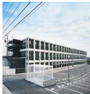
アイルームいなべ大安 (賃貸ワンルームマンション 78室)