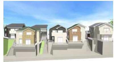
分譲地イメージ図

評価算出が難しい斜面地・法地や、古屋が建っていて権利調整が必要な土地など、現状では利用価値が低くなっている不動産について、地形を生かした利用方法の検討、法令上の調査、地域特性の把握、マーケティングなど当社の判断基準に基づき調査を実施し、取得・販売を行っております。