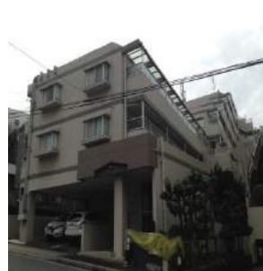
アークヒルズ虹ヶ丘 (賃貸ファミリーマンション 23室)