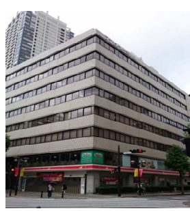
フジモト第一生命ビル (賃貸オフィスビル35区画)