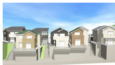
分譲地イメージ図

賃貸データ、ランニングコスト等を算出し、不動産から生じるキャッシュ・フローの分析を基に、用地周辺のマーケット動向を調査し、周辺の特성에応じたコンセプト（物件のデザイン性、利用者の機能性など）など企画し販売を行っております。