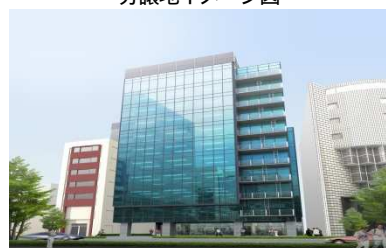
オフィスビルイメージ図