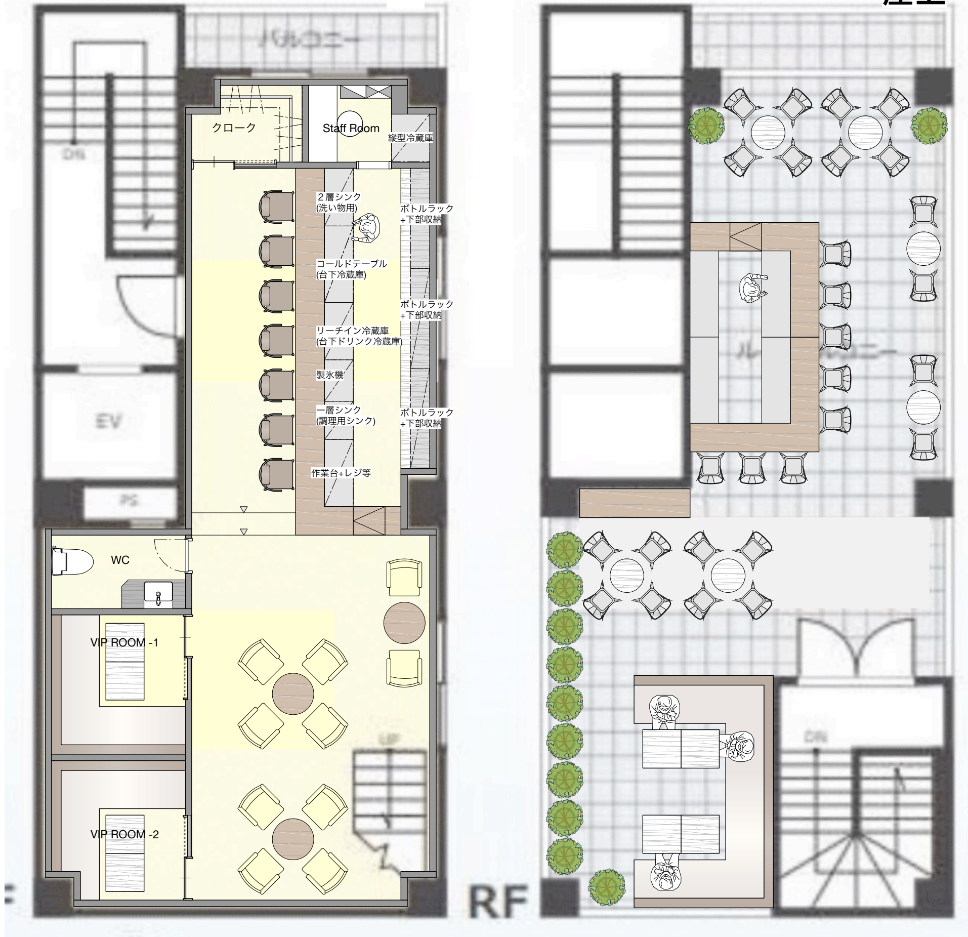
FACE四谷 6F/RF BAR LAYOUT PLAN